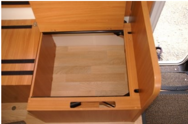
Imaginer les chaussures en vrac !