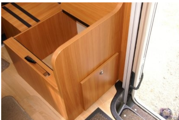
Il y a heureusement une porte latérale !!!!!