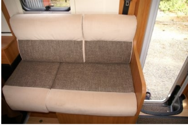
La banquette latérale.....