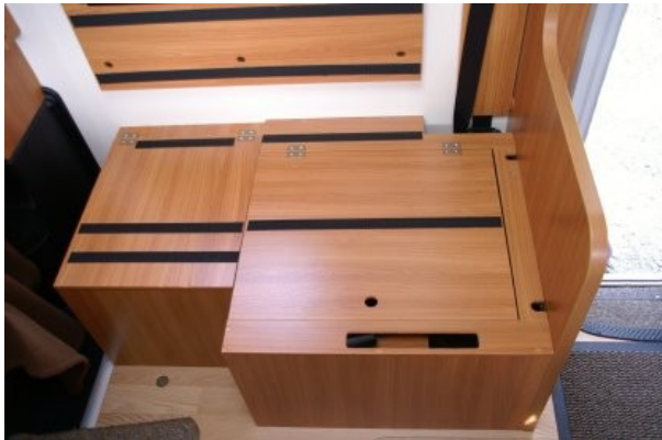
.....cache le coffre à chaussures.