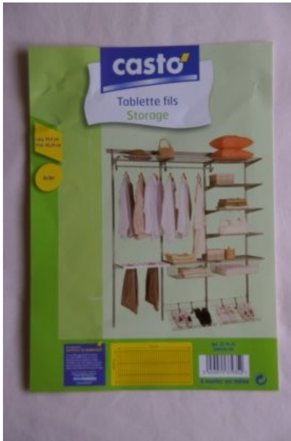
L'étiquette de la grille.